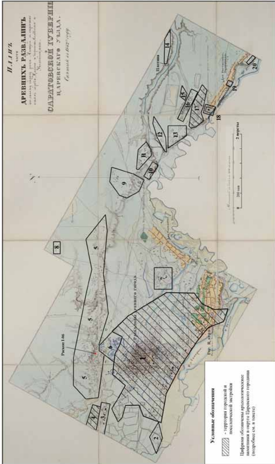
Рис. 2. Царевское городище и его округа на малом плане Н.К. Тетеревникова