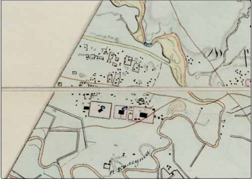
Рис. 3. «Северо-западный» пригород Царевского городища и район «ханских мавзолеев» (фрагмент малого плана Н.К. Тетеревникова)